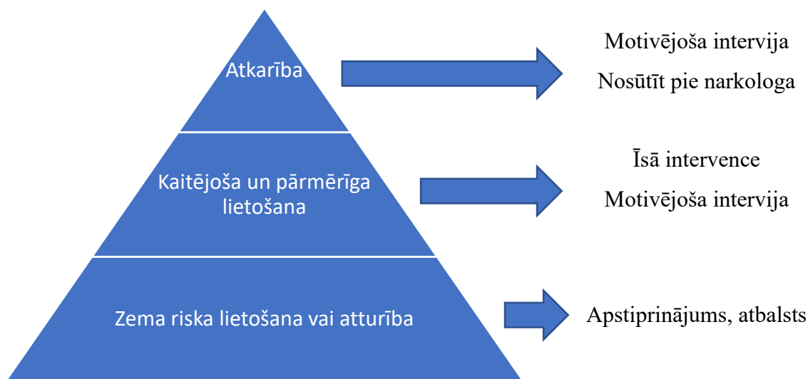
4.1. attēls. Intervences veidi atbilstoši kaitējuma līmenim [24], [17]